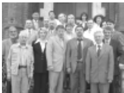
Министр здравоохранения республики Коми с членами комиссии по приему госэкзаменов в Сыктывкарском филиале нашей академии