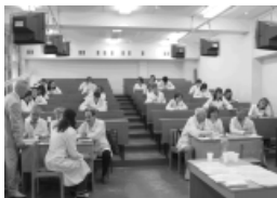
Идет госэкзамен на лечебном факультете

Трепетущие от волнения студенты 1-5 курсов у дверей экзаменационных аудиторий не идут ни в какое сравнение с сегодняшними выпускниками, сдающими госэкзамены. Держатся спокойно-уверенно, серьезно о чем-то переговариваются, не листают лихорадочно конспекты: во всем чувствуется, что преодолен какой-то важный рубеж, за которым осталось безалаберное студенчество, и началось осознанное вступление в «Е