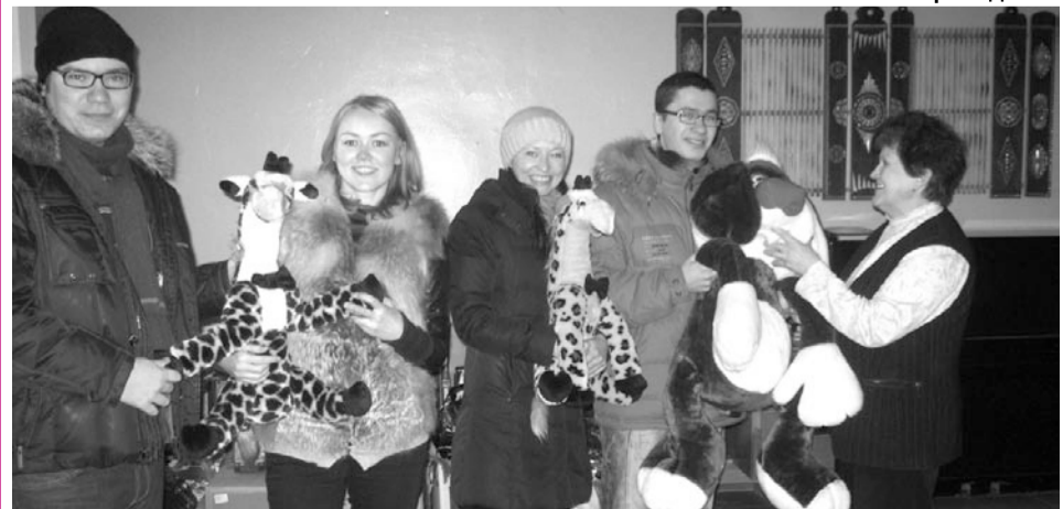
На снимке: студенты факультета экспертизы и товароведения принесли подарки в Детский фонд.

Студенты группы 372 факультета экспертизы и товароведения