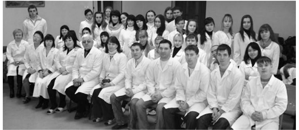
На снимке: студенты пятого курса с медперсоналом детского санатория «Талица».