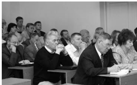
На снимке: заседание ученого совета.

22 января состоялось первое в текущем году заседание ученого совета. Присутствовали 26 из 33 членов ученого совета и более 40 сотрудников академии, студентов, аспирантов и соискателей.